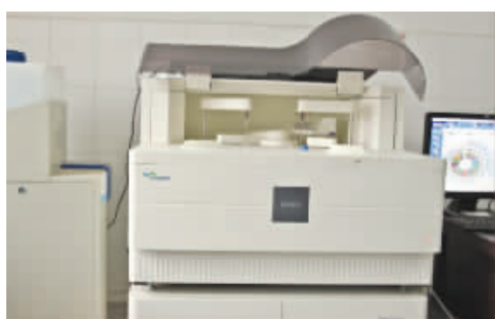
希森美康全自动生化分析仪