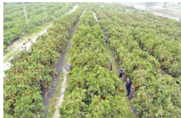
果农正在采摘清见

网上接单、地里采摘、现场装箱、快速发货……近日,四川仁寿县商务局举办的网上清见节开幕,在新店乡仁寿清见果业专业合作社清见示范园内,有人采摘,有人装箱,有人运输,他们各司其职,让全国各地的食客当天就能吃到新鲜美味的仁寿清见。当天,全县有5家电商参与线上销售,实现销量8100斤,销售收入63314元。 潘建勇 文/图