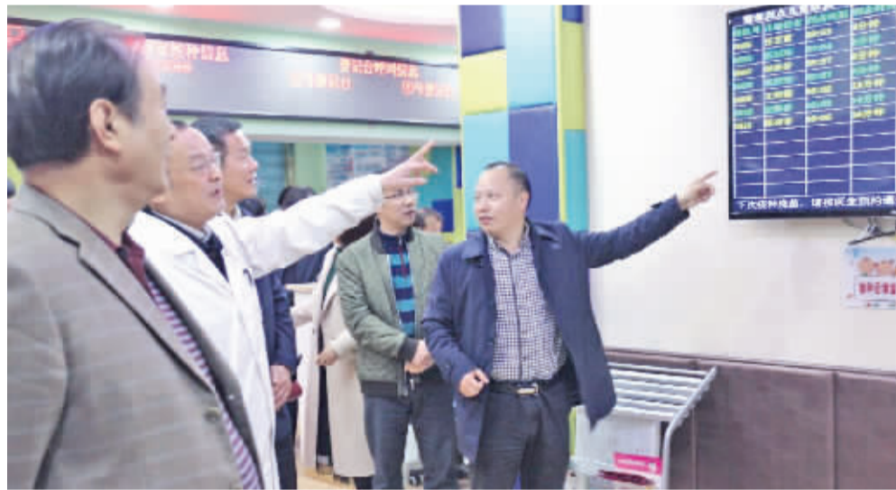
相关领导现场调研指导工作

2017年以来,在四川省苍溪县委、县政府和县卫计局及陵江镇党委的正确领导和大力支持下,全院职工坚持以“病人为中心”的服务理念,以提高医疗质量为重点,扎实开展“二乙”创建工作,医院管理水平和医疗服务质量进一步提高,并取得了良好的社会效益和经济效益。门诊工作量达到75000人次,收治住院病人3000余人次,分别较上年同期增长10%和8%,群众满意率达97%,无医疗事故发生。