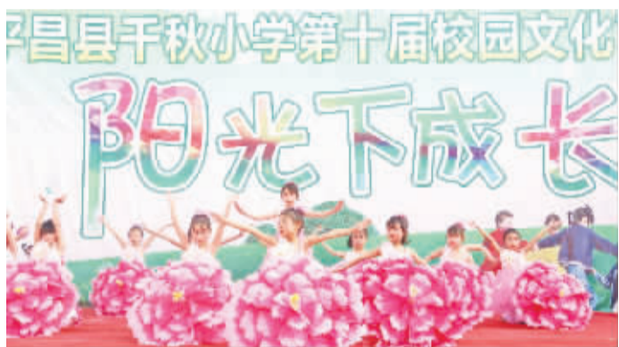
艺术活动丰富多彩

活动的举行,放飞着孩子们的梦想,张扬着学生的个性,他们用歌声和精彩的表演展现自己的青春活力,奏响美妙的艺术人生;搭建了学生勇于表现自我,放飞梦想的广阔舞台。该校将艺术的热情转化为学习的动力,用知识开启理想之门,必将创造出孩子们更加美丽的人生。赵芳 白成 文/图