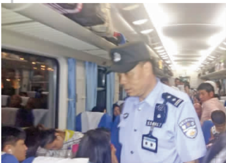
8月8日23时05分，K118次列车乘警对车厢进行检查巡视

畅工作。组织九环线各养护站点机械人员排查险情，清理垮方和飞石，确保灾区主通道安全畅通。组织开展应急养护巡查，对全市主要道路进行摸排并及时上报情况。落实机械140余台、人员220余人随时待命。做好抢通保通准备工作。并从距灾区最近的平武调派机械3台、技术人员5名奔赴九寨沟参与道路抢险救援。地震发生后，全市路政部门已出动执法人员125人次，执法车35车次，巡查道路，引导过往车辆，并在江油西环线路口、水口庙路口、大康路口和平武林家坝治超站设置了四处服务站，积极开展宣传解释和劝导工作，配合交警部门做好交通管制，目前已劝返大型货运车辆近200辆。