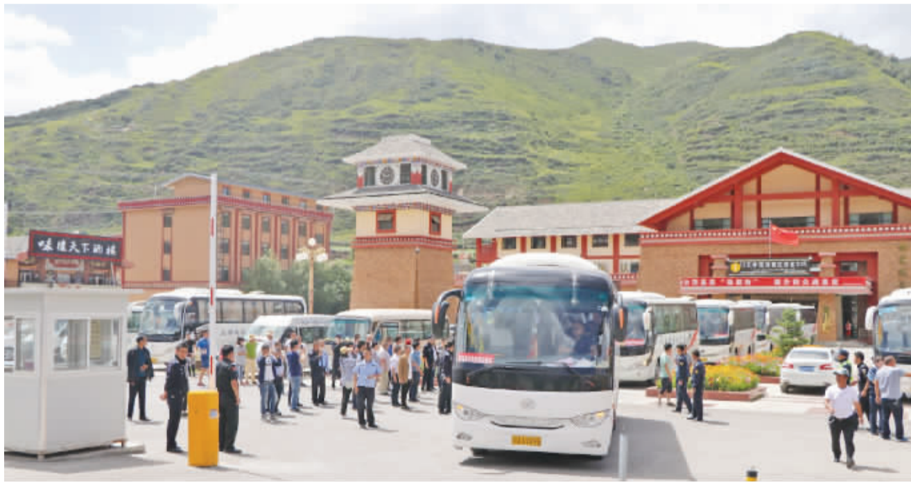
松潘县委、县政府安排车辆接送地震伤员回成都