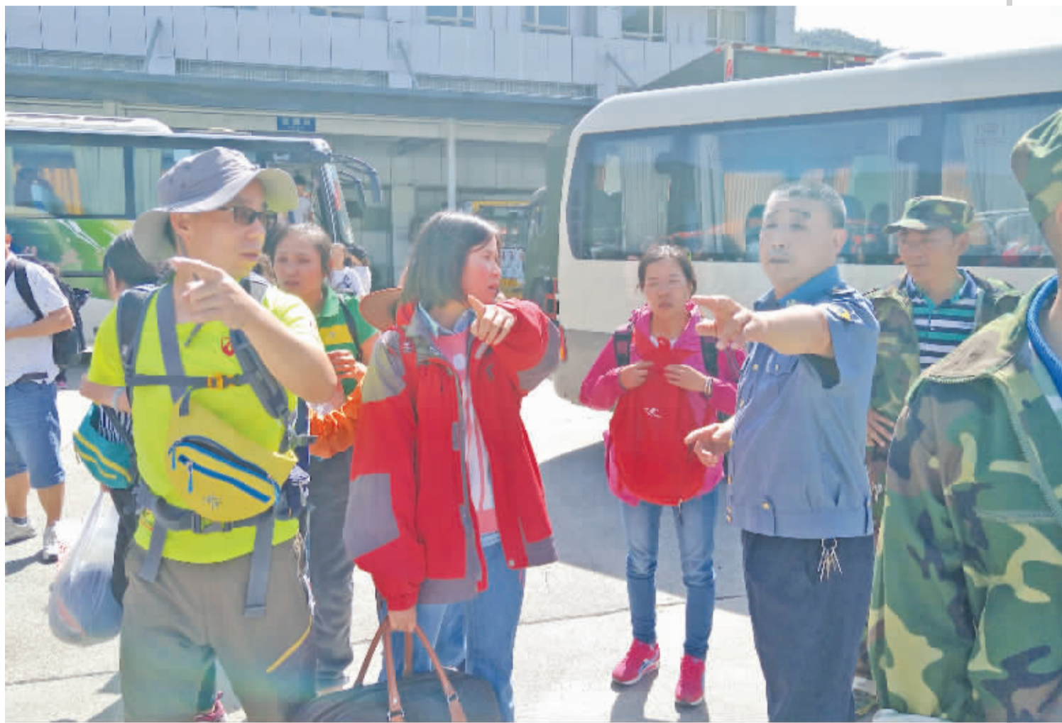
绵阳市交通工作人员在平武新车站疏散从九寨沟来的游客